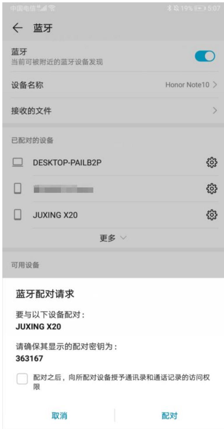
配对成功后，页面显示如图